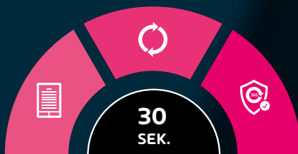
Abb.: Einfacher Onboarding-Prozess in drei Schritten

Mit 365 Total Protection schöpfen Sie das volle Potenzial Ihrer Microsoft Cloud Dienste aus.